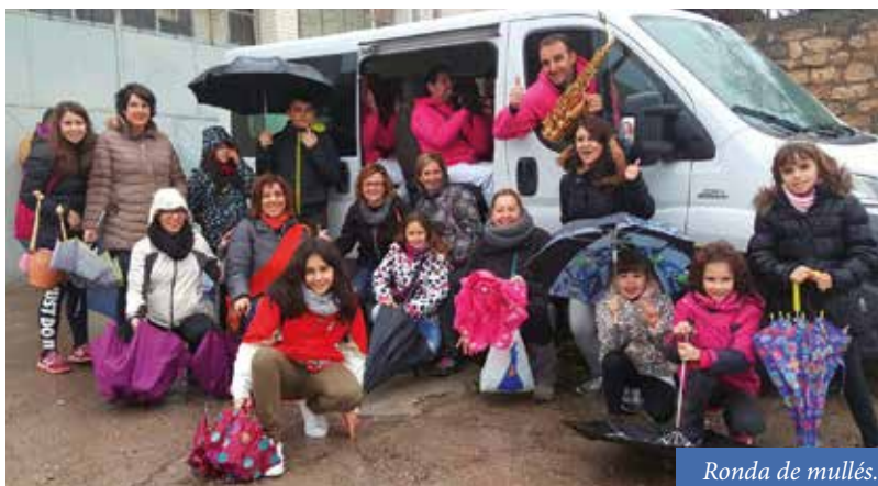
Ronda de mullés.

La lluvia fue la invitada no deseada pero no agüó las ganas de fiesta de las mullés . Bajo paraguas, fueron acompañando a la charanga El Pincho de ronda por las calles el sábado. Y el domingo, la misa en la que se bendijeron las tradicionales rosquillas que repartieron las águedas. El vermú en el Kalu y la comida en el polideportivo puso el colofón a cuatro días de fiesta.