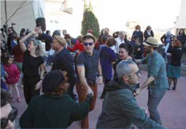
Grupo de bailarines de lindy hop en la edición pasada de la Trobada Jazz Fonç.

La Plaza de Fonç se convertirá por segundo año consecutivo el 30 de abril en una pista de baile para moverse al ritmo del jazz. La Trobada Jazz de Fonç sumará su cuarta edición y repite formato, apostando por el lindy hop . Se trata de una modalidad de jazz para bailar, que nació a comienzos del siglo pasado en EE.UU. Y que está ganando adeptos en la comarca, así como en Aragón. Así quedó demostrado el año pasado