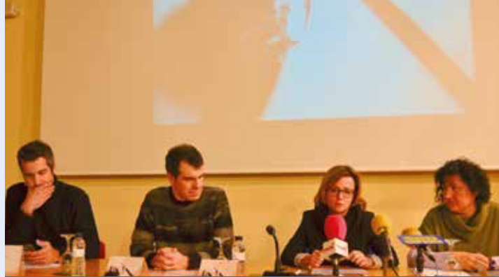
Representantes de los tres ayuntamientos.

El certamen promueve la preservación y difusión del bajoarribagorzano