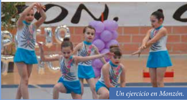
Un ejercicio en Monzón.

La próxima cita será el 8 de abril en Binaced.