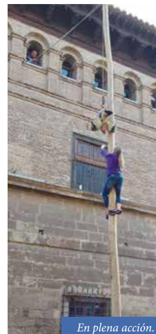
En plena acción.