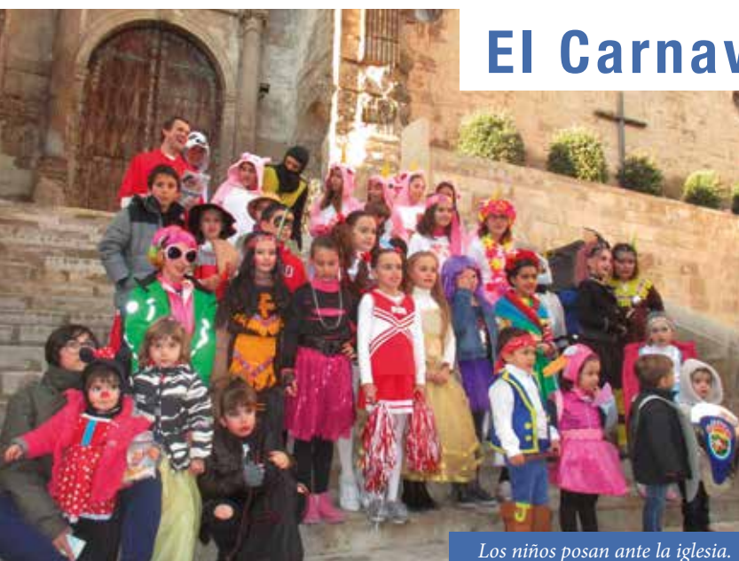
Los niños posan ante la iglesia.