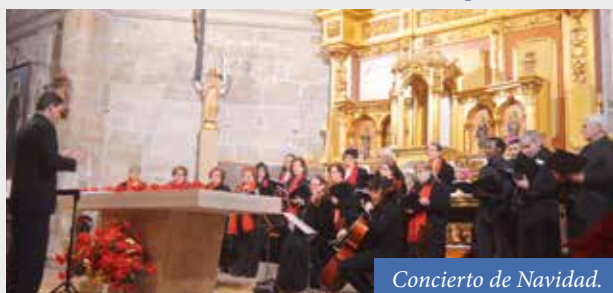
Concierto de Navidad.

La Coral Foncense participa el 8 de abril en Farlete en un encuentro con la coral de esta localidad zaragozana. Las dos formaciones interpretarán a partir de las 18,00 h cinco canciones cada una y dos en conjunto, 'Solamente una vez' y 'Va pensiero'. La jornada pretende ser un día de hermandad, que tendrá continuidad el próximo año con un nuevo encuentro en Fonz.