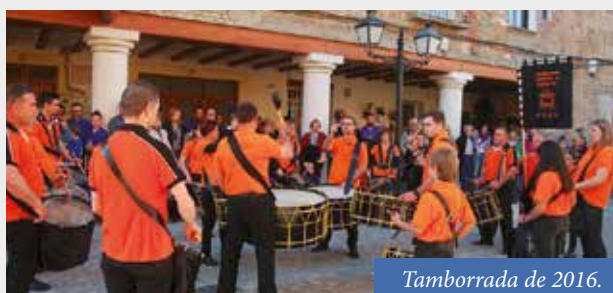
Tamborrada de 2016.

La Asociación de Bombos y Tambores de Fonz organiza la XII Tamborrada que tendrá lugar en la Plaza el 20 de mayo a las 18,00 h. Se espera contar con la presencia de las bandas y secciones de instrumentos de las cofradías de Azanuy, Binéfar y de la población leridana de Raimat.