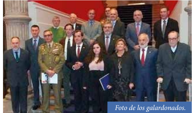
Foto de los galardonados.